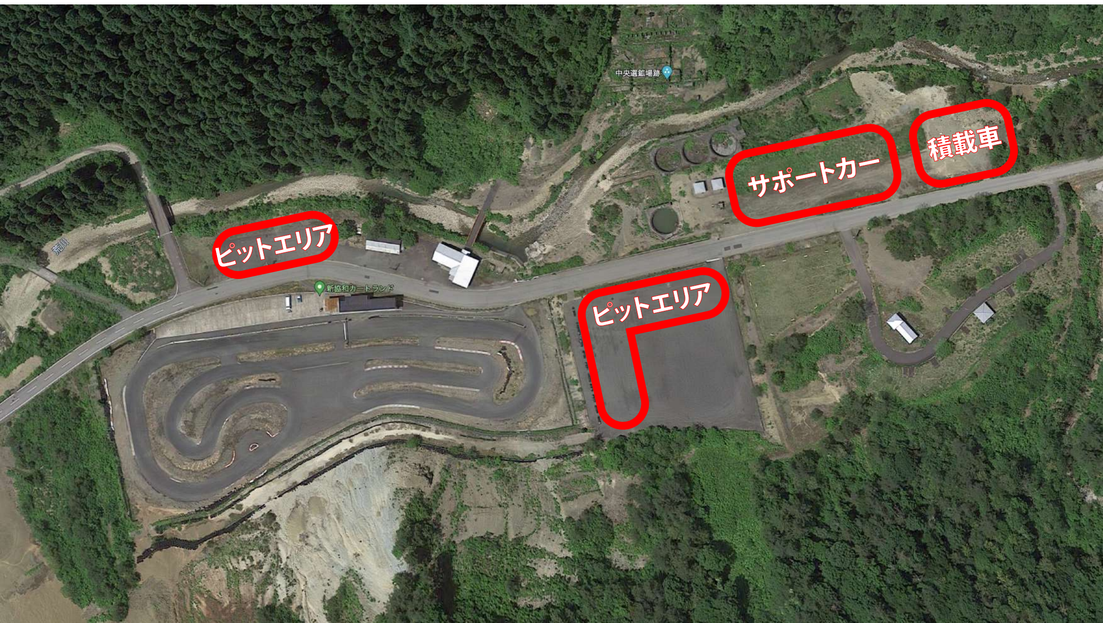
ピットエリア及び各駐車場マップ