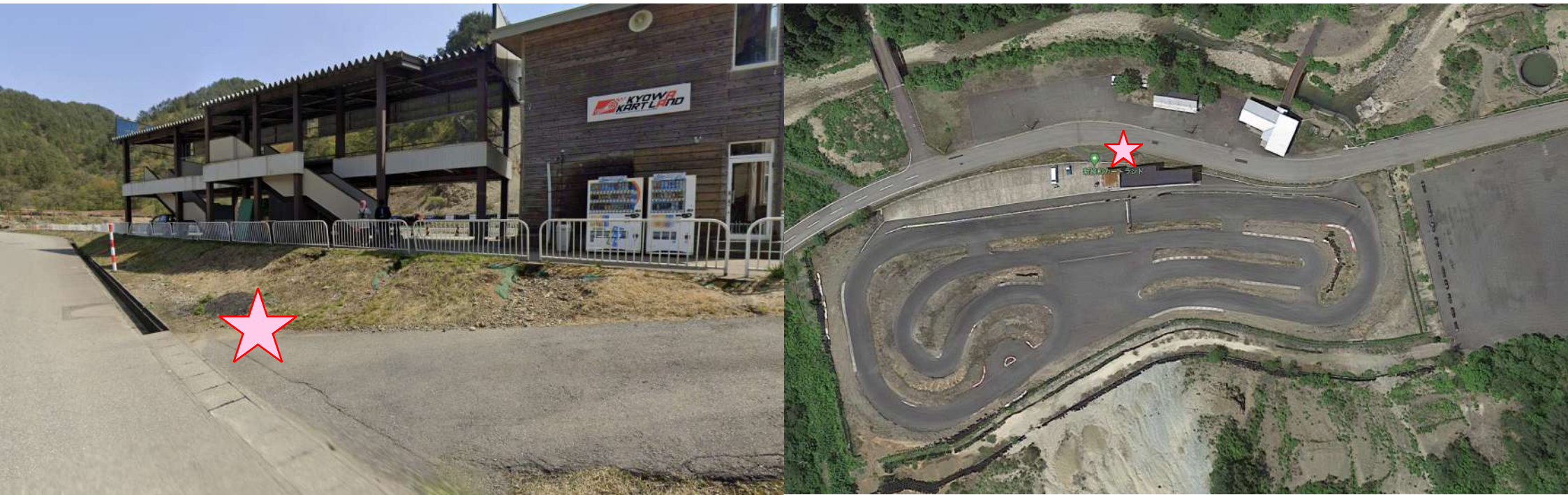
エアチェックエリア