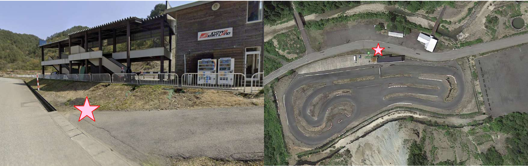
エアチェックエリア