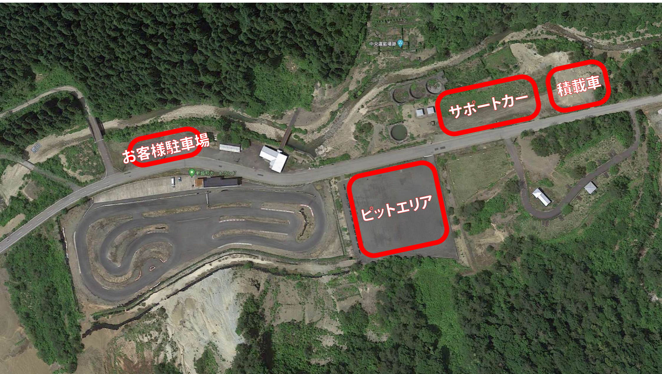
ピットエリア及び各駐車場マップ